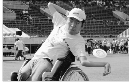
後ろ向きになって...